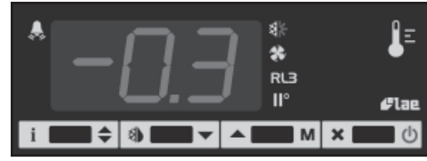
ŞEKİL 1 — Ön panel