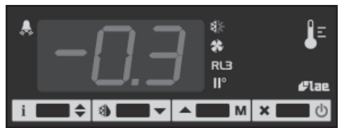
Fig.1 - Painel frontal